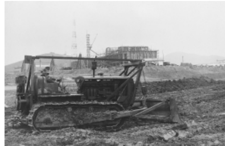
초기 공사공사 광경

인하대학의 부지는 이승만 대통령의 각별한 관심 하에 인천시 용현동과 학익동에 마련되었다. 구전에 의하면 이승만 대통령이 표양문 인천시장 등을 대동하고 학교 부지에 있는 산 위에 올라 학교부지의 윤곽을 넓게 지시하여 멀리 학익동 형무소 부근까지 이르렀지만, 실제로는 125,173평에 그쳤다. 180명의 신입생을 받아들일 계획을 세우고 있던 신설 공과대학으로서는 그렇게 넓은 학교부지가 필요없었을 것이다. 인천시 소유였던 이 땅은 국무회의의 의결을 거