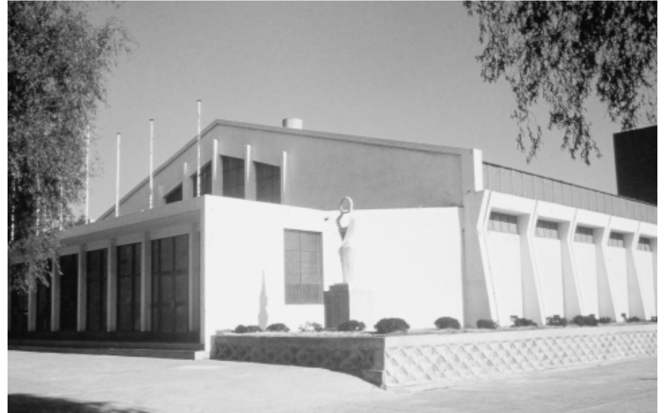
하와이교포기념 체육관·하와이로부터의 성금을 기초로 건축되었다.

한인기독교학원의 설립과 교사 및 기숙사 건축, 그리고 경상비의 운영 등도 주로 하와이 교포들의 재정적 후원에 의존한 것이었다. 이승만은 심지어 식민지가 된 조국에서 기금을 모금하는 활동을 전개하여 논란이 되기도 하였다. 한인기독교학원에서는 새