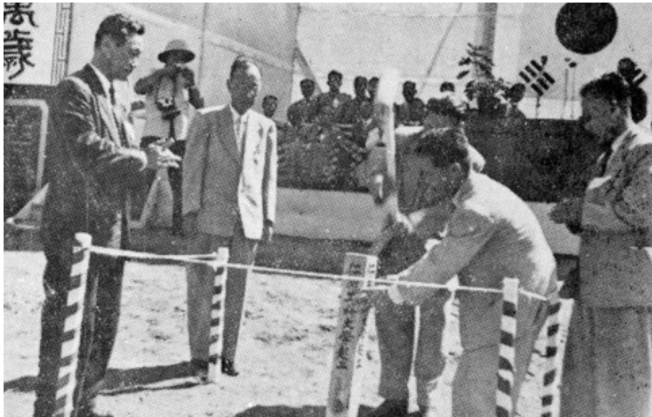
인하공과대학 기공식(1953. 8. 28)