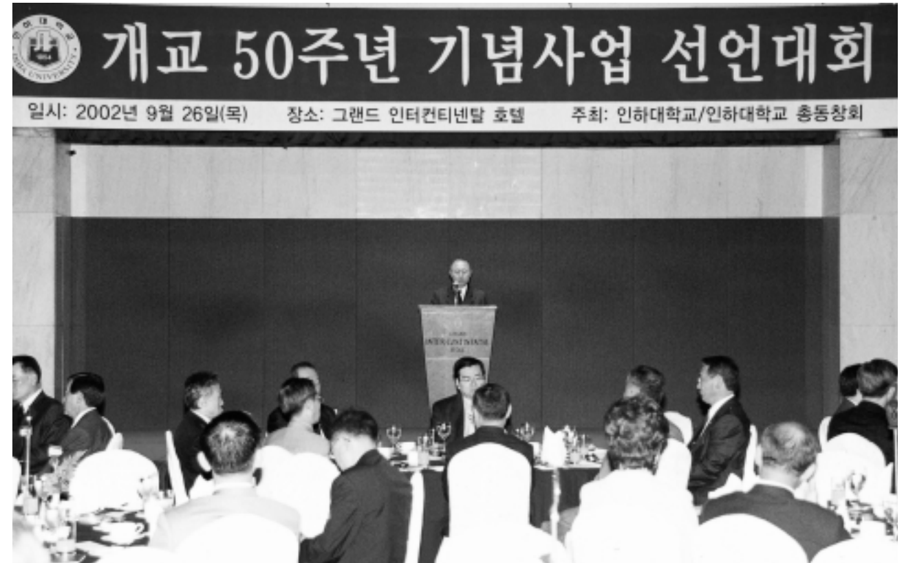
개교 50주년 기념사업 선언대회(2002. 9. 26)