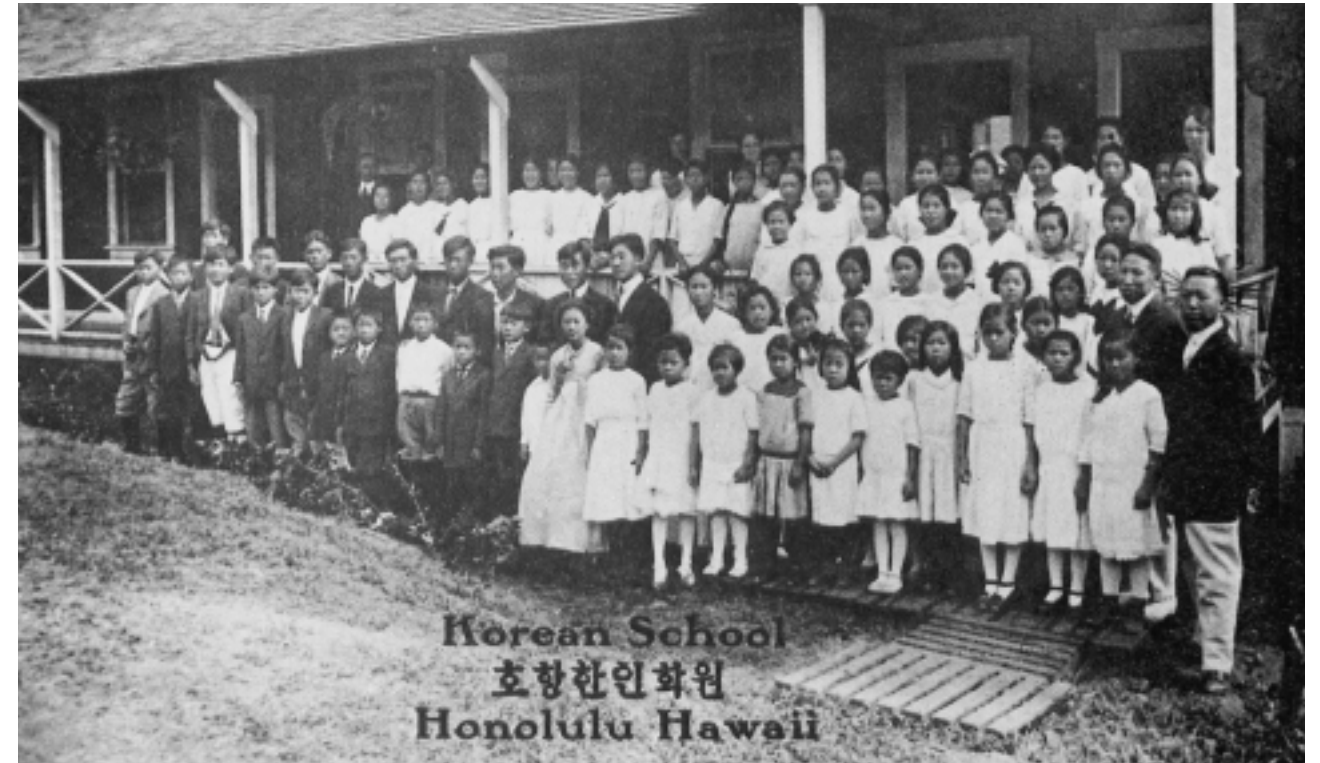
하와이 한인학원 교장시기의 이승만

원으로는 위원장 문교부장관을 비롯하여 각부 차관, 외서관리청장, 인천시장, 하와이교포 대표, UNKRA(유엔한국부흥위원단) 대표, UNCAC(유엔민사처) 대표, 교육계인사, 정부산하기관 및 공사·회사의 책임자 등 47명으로 구성되었다. 4월 3일에는 정부에서 학교설립자금으로 100만불을 부담하기로 국무회의에서 의결하였다. 6월 4일에는 이승만 대통령이 담화를 발표하여, 학교설립 자금으로 총 515만불이 들어가는 데 하와이 교포의 15만불과 정부의 100만불 이외에, 부족한 부분을 모든 남녀 동포가 적은 액수라도 원조하여 보충해 달라고 촉구하였다. 설립기성위원회는 인천시장이 할애한 사유지 125,173평을 확보하여 교사와 부속공장을 건축하고, 재정을 확보하고, 재단법인 설립을 준비하여, 1954년 2월 5일 인하공과대학을 운영할 주체로서 재단법인 인하학원을 설립, 인가를 받고, 동시에 인하공과대학의 설립 개교도 인가를 받았다. 그리하여 금속공학과, 기계공학과, 광산공학과, 전기공학과, 조선공학과, 화학공학과 의 6개 학과에 각각 30명씩 180명을 모집하여, 1954년 4월 24일 입학식을 거행하고 인하공과대학을 출범시켰다.