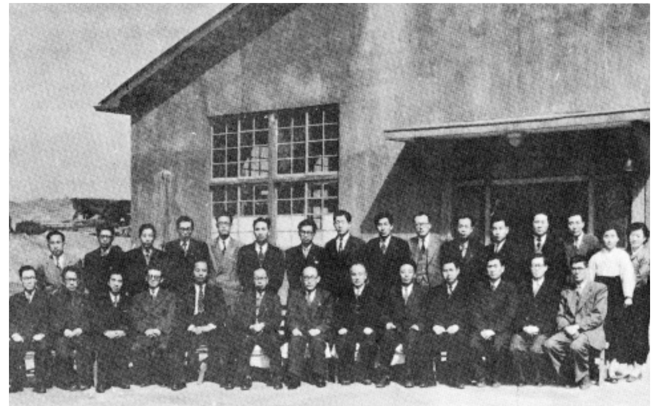
개교시의 인하공과대학 교수진