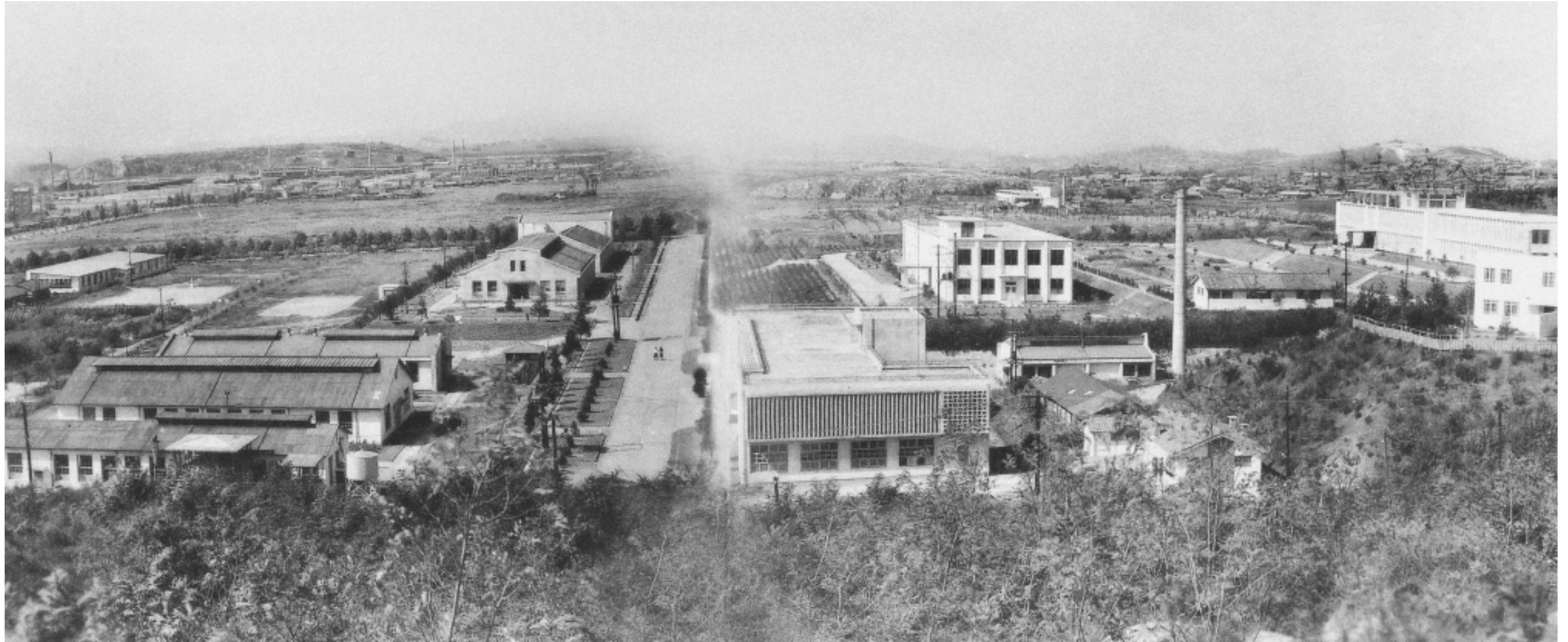
1960년 인하공과대학 전경