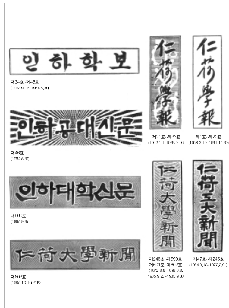
인하학보의 모습 사진

창간 당시에는 월간으로 배대형 4면으로 발행되었고, 체제는 통상적인 형식을 취하였다. 제1면은 주로 학내의 동정과 학외의 학술, 문화계 동향 등의 소식을 싣고, 좌상단에 사설, 하단에 「餘摘放談」란과 인사 및 메모란을 두었다. 제2면은 교수들의 학술논문, 제3면은 학생회의 행사와 활동을 보도하고, 학생문예란, 교수프로필란, 과학기술질의란 등을 설치하였고, 제4면은 학생논단 및 학생연구논문을 주로 담았다.