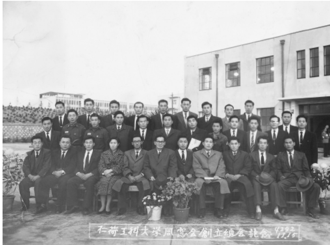
동창회 창립총회 (1959. 11. 15)