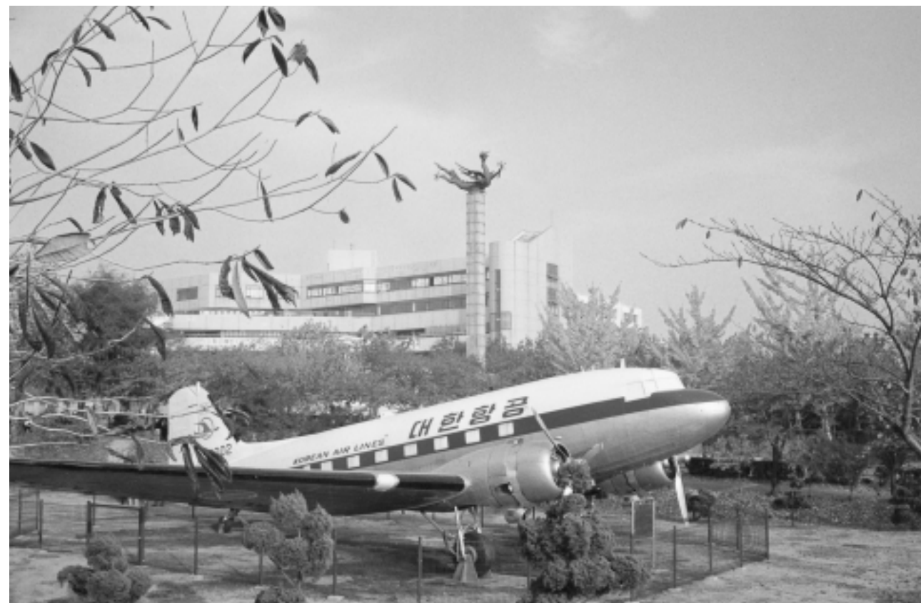
1954년 도입된 DC3형 항공기: 국적기로 최초의 태평양 횡단을 하여 하와이교포를 귀국시켰다.

1957년 2월 9일 인하학원은 대한양회공업주식회사에 투자할 수 있도록 한국저축은행으로부터 3억원의 융자를 문교부에 요청하고 문교부에서는 재무부에 특별 추천하여 융자를 성사시켰다. 즉 대한양회에 3억원을 대부하고 그 제품 생산량에 대하여 한 부대에 80전의 비례로 재원을 확보하기로 하여, 1957년 12월부터 1960년 11월까지 3년간의 기한으로 계약이 성립되어 시행되었다. 여기서 얻어지는 수익 9억7천5백만환 가운데 시설비에 556,779,618환(화공관, 전