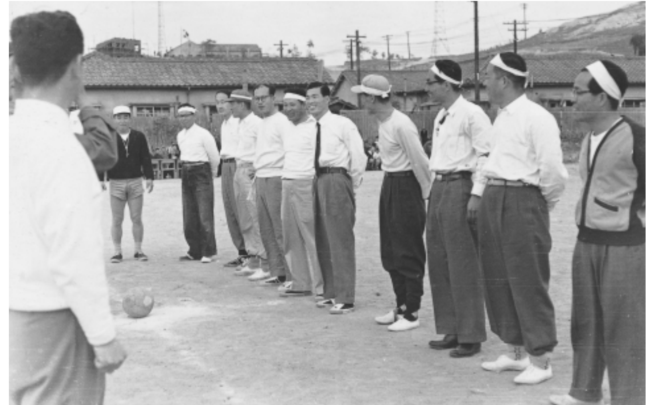
개교 1주년기념 교내체육대회

학생자치기구로서 학도호국단 외에 각 공학과 별로 학우회를 조직하여 친목을 도모하고 학술연구의 발전을 꾀하였다. 각 공과 별 학우회는 전국 각 대학의 동일 전공