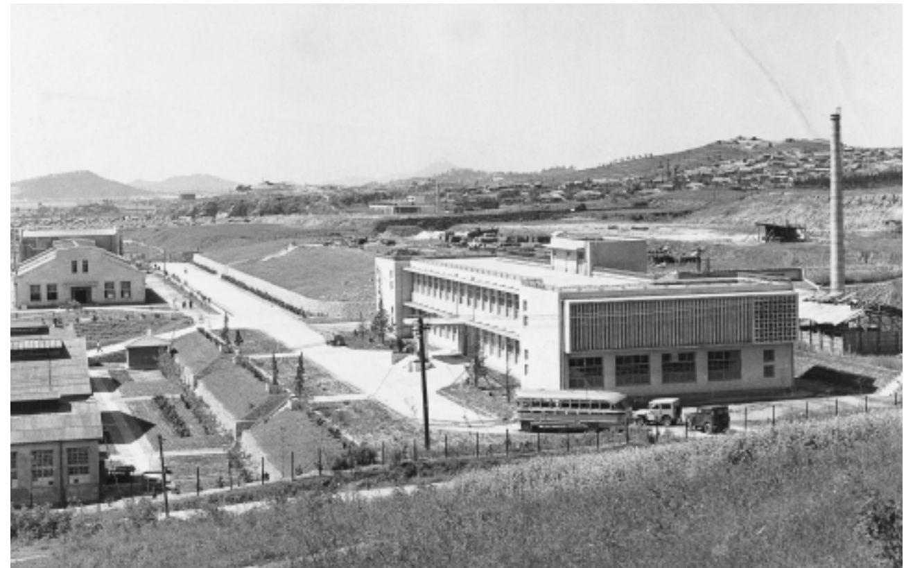
1958년경의인하공과대학 : 우측이 기계공학관 신축교사

공과대학에 필수적인 실험실의 설비도 점차 개선되어 각 학부별로 실험실이 완비되어 갔다. 1958년에는 범한무역주식회사를 통하여 물리화학 실험기구를 도입하였다. 기계과 실험기구는 71,667불, 광산과는 36,704불, 금속과는 41,427불, 전기과는