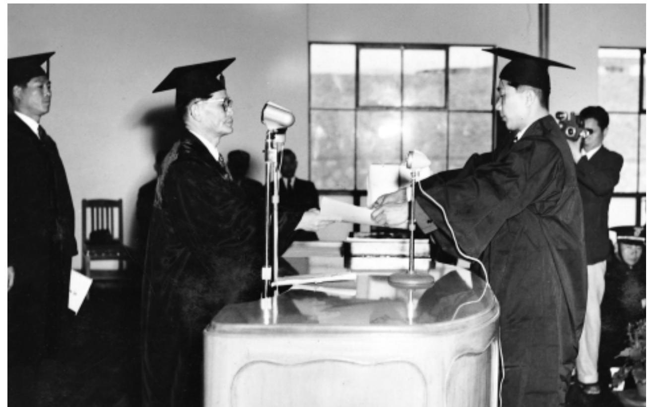
제1회 학위수여식 (1958. 3. 18)

오늘날 원자무기가 도입되고 있는 이때에 우리는 젣트기 비행기도 만들며, 모든 것을 우리의 손으로 만들어서 남에게 뒤떨어지지 말아야 할 것이니, 이 렇게 하자면 과학을 잘 배워야 할 것이다.