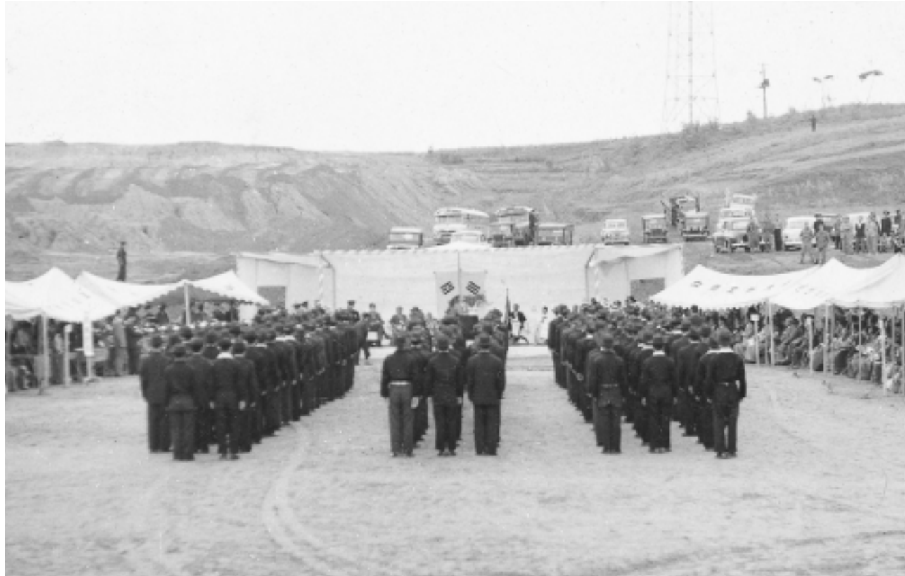
인하공과대학 개교기념식 (1954. 10. 5)