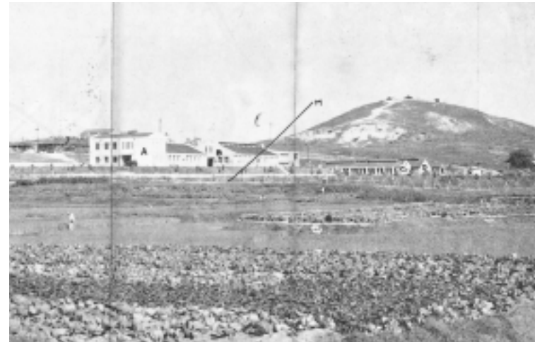
개교시 교내 주변의전경